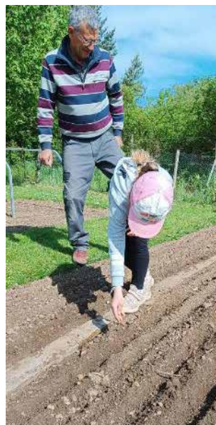
Un semis en cours

Après préparation de deux parcelles de jardin que nous avions réservées à cet effet, les jeunes jardiniers ont semé chacune de ces graines et bien sûr, de la même manière que leurs petits jardins, ils vont suivre l'évolution de ces cultures pratiquées habituellement par des agriculteurs, mais qui sait, nous avons peut-être de futurs céréaliers parmi nos jeunes pousses !