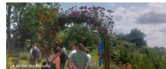
Le jardin des Minuits

Première étape au jardin du théâtre des Minuits à la Neuville-sur-Essonnes où nous avons bénéficié d'une belle visite commentée de ce jardin surprenant.