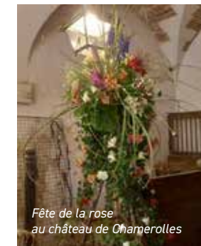
Fête de la rose au château de Chamerolles

La section a participé à l'animation organisée par la Route de la Rose au château de Chamerolles les 7 et 8 juin dans le cadre de la « Route de la Rose en Fête ». Un atelier de sculpture sur légumes a attisé la curiosité des enfants qui repartaient satisfaits de leur composition.