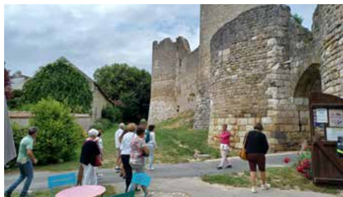
Yèvre le Châtel un guide de choix