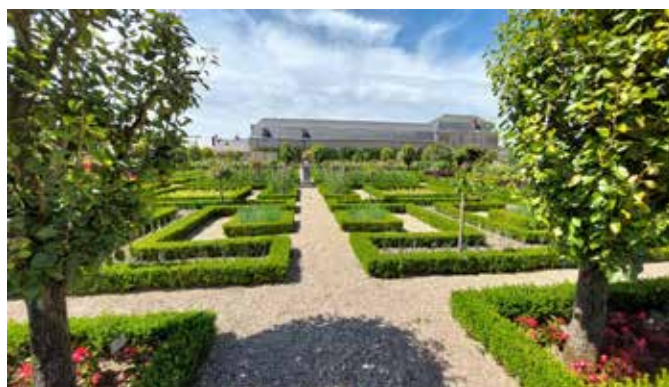
Vue des jardins

Sept jardins, organisés d'après la classification établie par Joachim Carvallo lui-même – potager-verger, jardin d'ornement et jardin d'eau – naissent de cette entreprise monumentale : le Potager d'Ornement, le jardin de l'Amour et des Croix, le jardin de Musique, le jardin des Simples, le Labyrinthe, le jardin du Soleil, le jardin d'Eau.