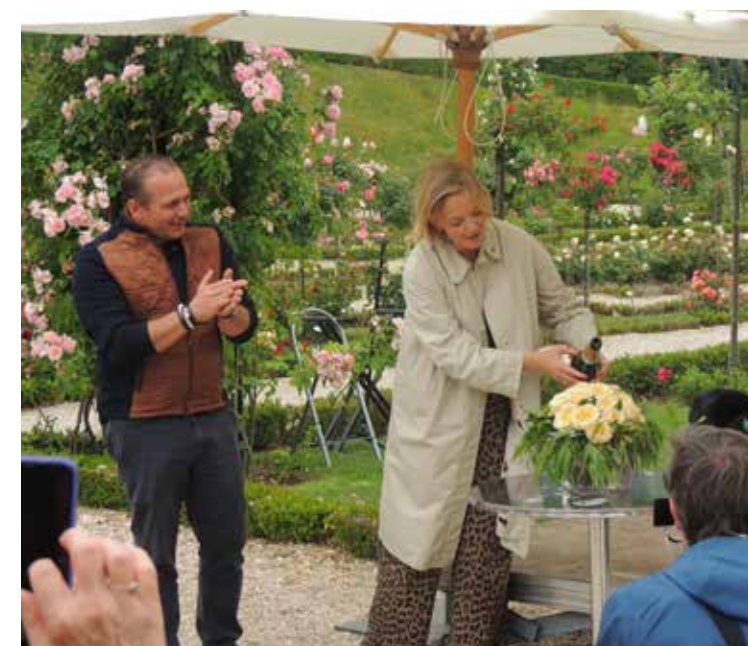
Baptême de la rose Honey perfumella par Maya Lauqué

Et même assister à un baptême de rose dont la marraine était Maya Loqué (journaliste de Télématin sur France 2), une nouvelle rose sur le marché en octobre, une création de Meilland qui se nomme 'Honey Perfumella'.