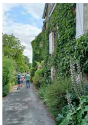
Découverte des ruelles

Elle nous a fait découvrir les ruines du château médiéval, son histoire et expliqué la partie sauvegarde de cette forteresse.