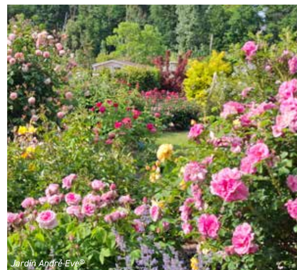
Jardin André Eve®

Le jardin est libre d'accès toute l'année aux horaires d'ouverture de la boutique. Et si vous passez en dehors de ces horaires, n'hésitez pas, sonnez et nous vous ouvrirons !