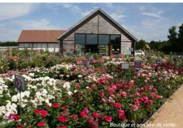
Boutique et son aire de vente

Dans cet esprit, des cours de taille sont dispensés chaque hiver, sur inscription.