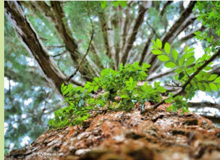
Arboretum des Barres