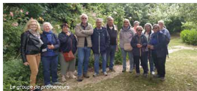
Le groupe de promeneurs