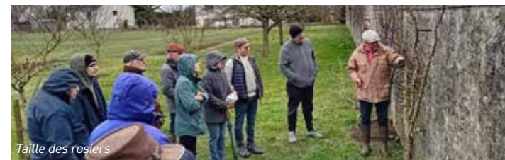
Taille des rosiers

Le 22 février, une dizaine d'adhérents a profité d'une démonstration de taille d'arbres fruitiers, et notamment des amandiers. Tous sont repartis satisfaits des techniques apportées qu'ils se sont promis de mettre en œuvre rapidement dans leur jardin.