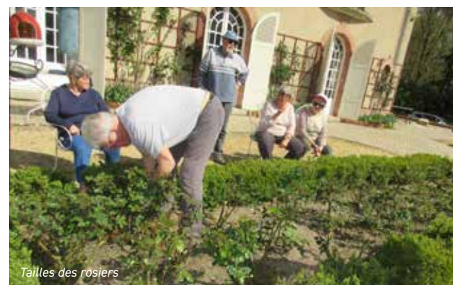
Tailles des rosiers

- En mars, un après-midi taille des rosiers et arbustes, dispensé par M. Serre s'est déroulé dans le jardin de Mme Poirier à la grande satisfaction des participants.