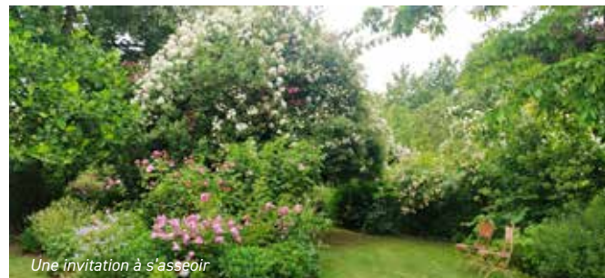
Une invitation à s'asseoir

Notre groupe s'attarde sur telle ou telle variété ; instantanément, on relève le nom de l'une parmi d'autres qui attire un peu plus