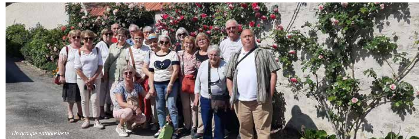
Un groupe enthousiaste