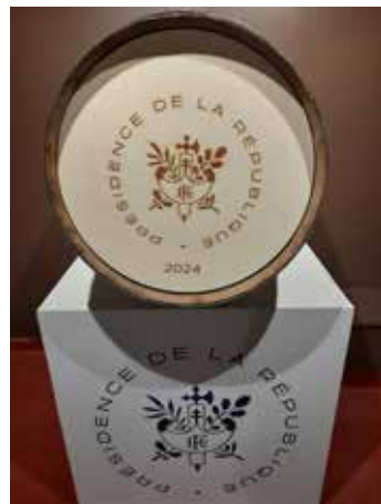
Un petit chai ouvert au public est installé pour les vinaigres d'exception réservés aux chefs cuisiniers et à la présidence de la République

S'ensuit un vieillissement du vin d'un an, dans des foudres de 35000 litres, à l'issue duquel le vinaigre est soutiré et mis en bouteille.