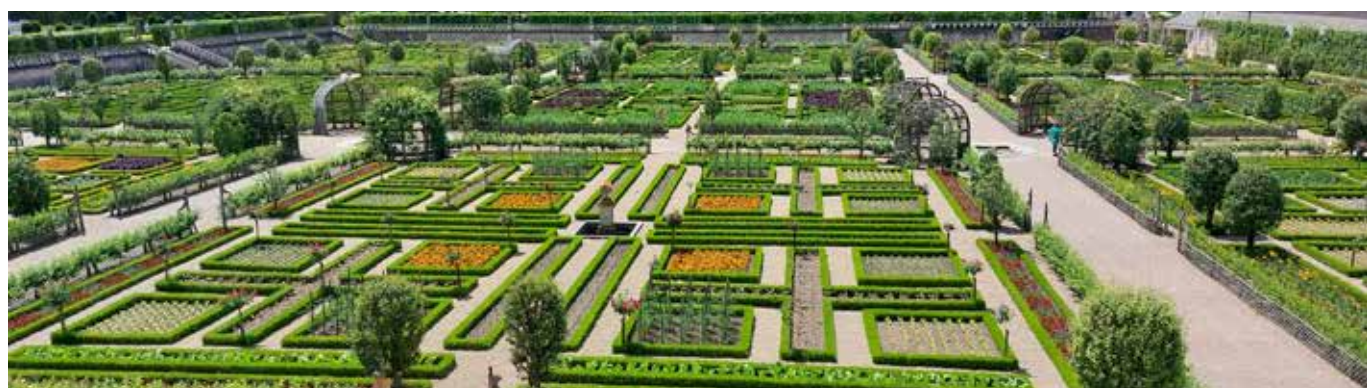
Perspective des jardins