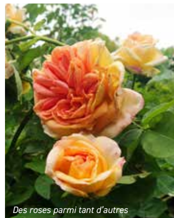
Des roses parmi tant d'autres