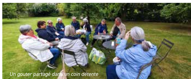
Un gouter partagé dans un coin détente

Labellisé Jardin Remarquable et situé sur la Route de la Rose, on ne peut que succomber au charme de ce jardin... Au gré de notre promenade, nous avons pu croiser des poules, des coqs, des paons et pour clore notre errance, nous nous sommes installés dans un coin paisible du jardin. Nous avons regroupé tables et chaises en fer rouillé pour déguster un gouter partagé, un moment très convivial et bien sympathique.