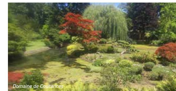
Domaine de Courances

L'après-midi, c'est au Domaine de Courances que les participants ont pris part à une promenade fort sympathique sous les ombrages. Une admiration particulière pour le Jardin Japonais.