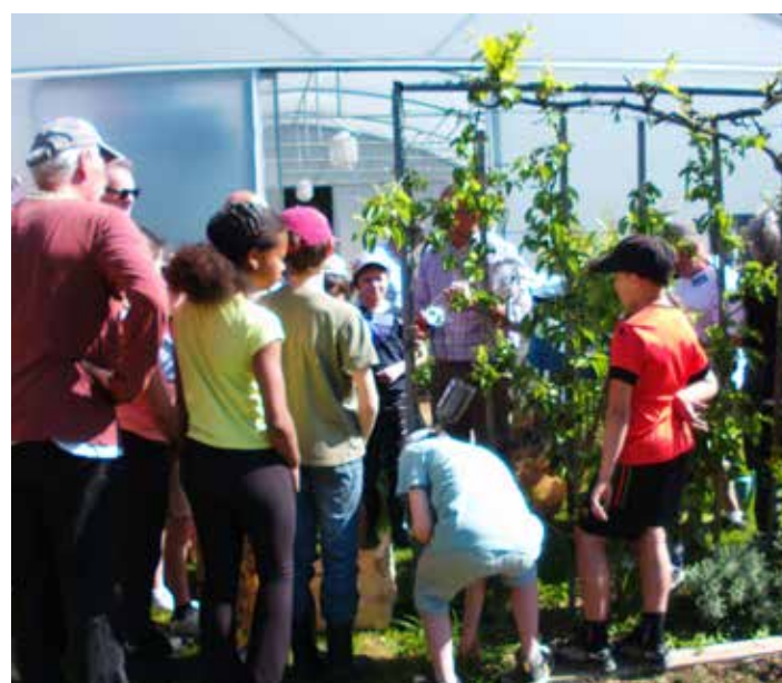
Un groupe d'experts

Puis changer l'alcool par de l'eau de vie de poire William's.