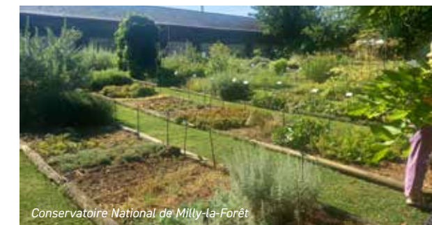
Conservatoire National de Milly-la-Forêt

Le 04 juillet, un groupe d'adhérents s'est donné rendez-vous au Conservatoire National des plantes médicinales et aromatiques à Milly-la-Forêt, où chacun a eu l'occasion d'enrichir ses connaissances par une visite guidée. Une pause pique-nique a été la bienvenue sous le platane du conservatoire.