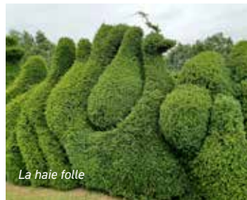
La haie folle