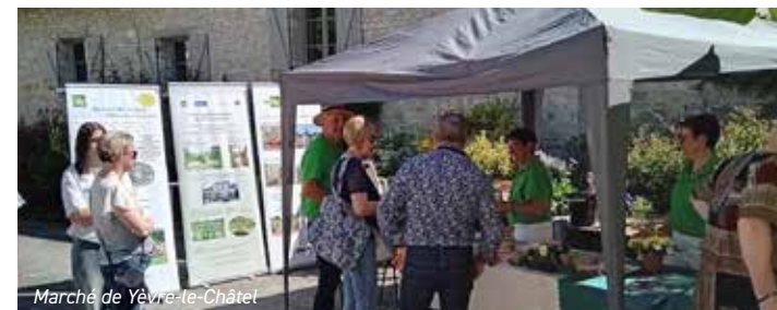
Marché de Yèvre-le-Châtel

Le 1 er mai, un public toujours aussi nombreux pour le grand marché de Yèvre-le-Châtel. La section proposait de l'art floral aux enfants, du semis de graines et une reconnaissance d'herbes aromatiques.