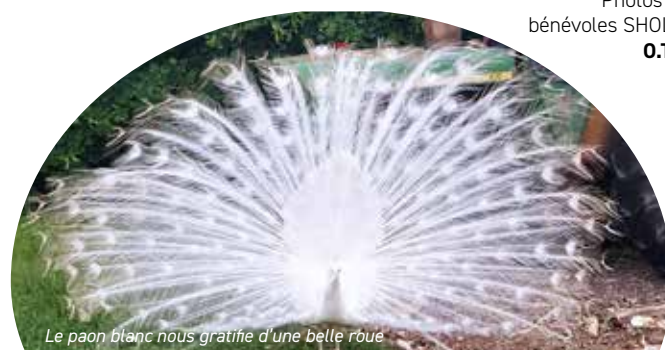
Le paon blanc nous gratifie d'une belle roue