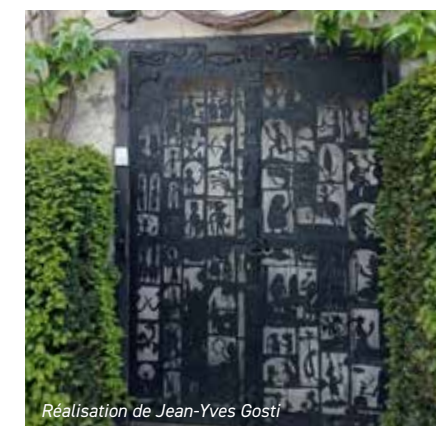
Réalisation de Jean-Yves Gosti

La déambulation dans ce village où les parterres de fleurs, de roses, les plantes vivaces qui ont remplacé les trottoirs a été un plaisir pour tous.