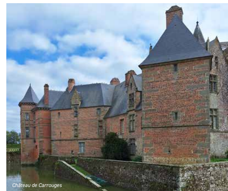
Château de Carrouges