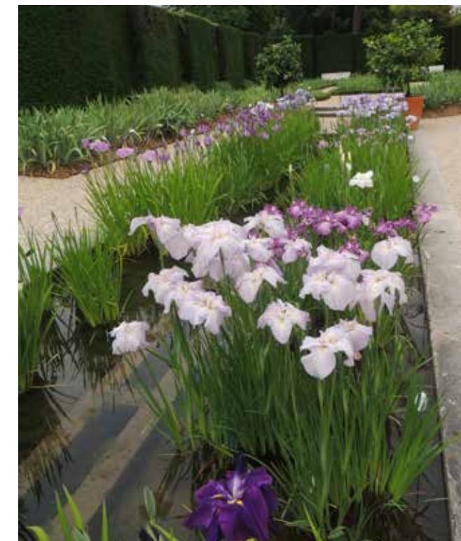
Collection d'iris ensata

Quartier libre l'après-midi, de quoi visiter les magnifiques jardins, potager, jardin aux iris, en pleine floraison, les pieds dans l'eau l'Iris ensata ou iris du Japon... retourner admirer, contempler nos rosiers préférés, participer au Prix du Public 2026 en votant pour nos 3 rosiers préférés, faire un tour parmi les rosiers mis à la vente, déguster une délicieuse glace à la rose...que du plaisir !