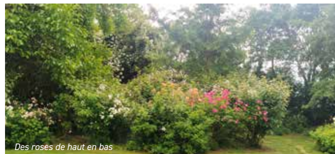
Des roses de haut en bas