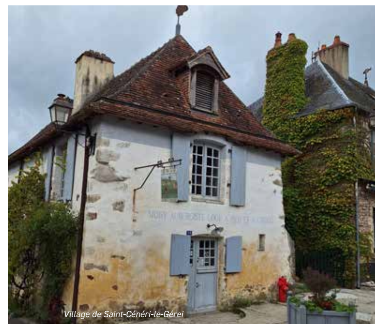
Village de Saint-Cénéri-le-Gérei