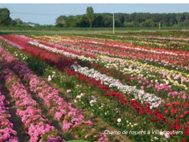
Champ de rosiers à Villemoutiers

En 2022, Les Roses André Eve ont repris l'entreprise La Vallée des Merles à Villemoutiers à 30 mn de Gallerand. Cette reprise a permis de développer notre culture de plein champ et d'augmenter notre collection variétale qui atteint maintenant près de 900 variétés.