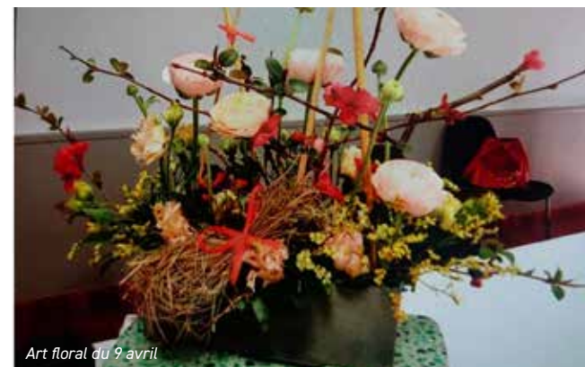
Art floral du 9 avril

- Un programme annuel d'art floral a été présenté aux adhérents et 5 animations en février, mars, avril, mai et juin, ont déjà été réalisées avec en moyenne 10 participants.