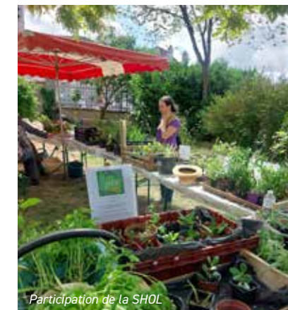
Participation de la SHOL

- Le 10 mai, notre section a participé à la fête des plantes de Beaulieu-sur-Loire.