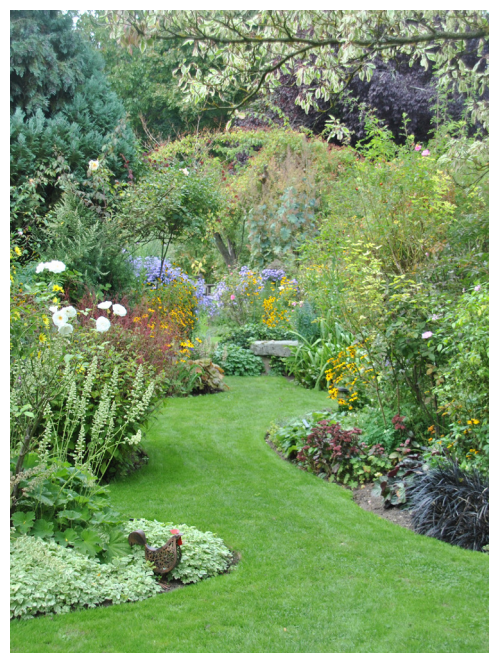
Jardin personnel d'André Eve